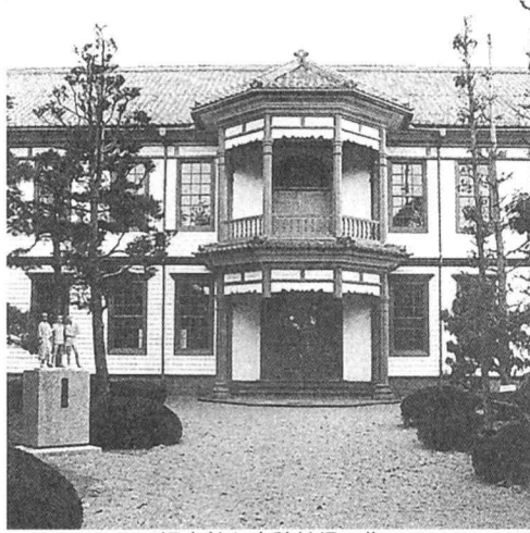
旧本館と安積健児の像

普通科 一年 2180 二年 2182 三年 2173 校章由来 現校名になった昭和23年に新しく設定された。桑の葉の中に、安の字を桜の花で図案化したものである。