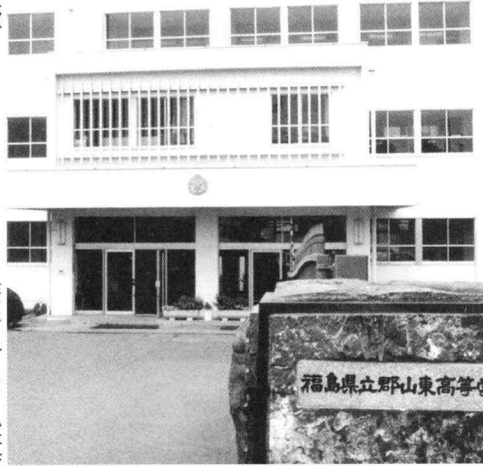
作詞 谷川 俊太郎 作曲 藤原 義久