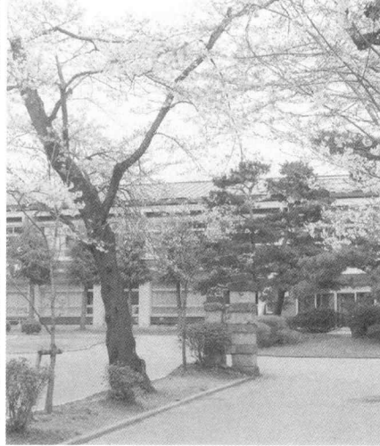
作詞/校歌校章検討委員会 作曲/小田 和正