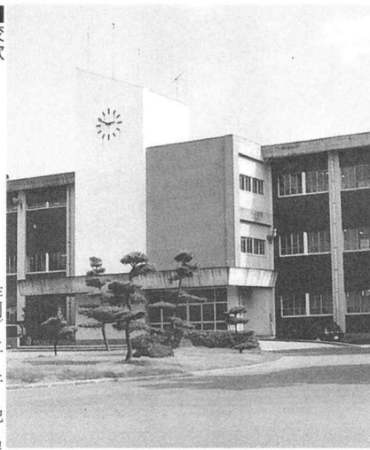
作詞/土井 晩翠 作曲/古関 裕而

機械工学科 一年 六七 二年 六一 三年 六五 電気工学科 一年 三九 二年 三五 三年 三九 制御工学科 一年 三六 二年 三八 三年 三〇 土木環境工学科 一年 四〇 二年 三六 三年 三六 情報工学科 一年 三四 二年 三九 三年 四〇 校章由来 現校章の図案は「平工高」の文字の周りを日本の象徴ともいえる桜の葉と花、つぼみで包んだものである。