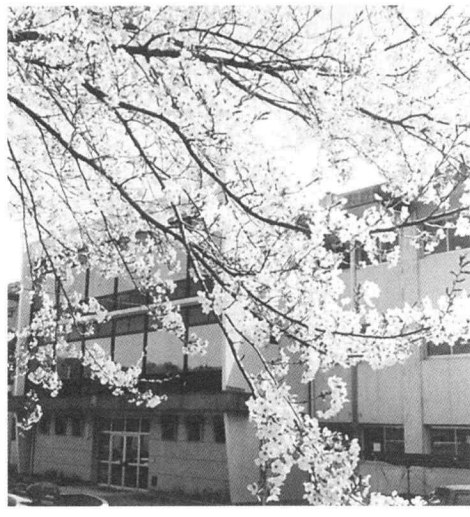
作詞/西條 八十 作曲/中山 晋平

生徒数 二四二六 (男子88 女子358) 流通ビジネス科 一年 七七 二年 七九 三年 六二 情報システム科 一年 三五 二年 四〇 三年 三六 オフィス会計科 一年 三三 二年 三九 三年 二六 校章由来: ギリシヤ神話の商業の神ヘルメスにちなみ、その有翼の杖(ケリーユケイオン)と杖にからむ二匹の蛇をデザイン化したものである。